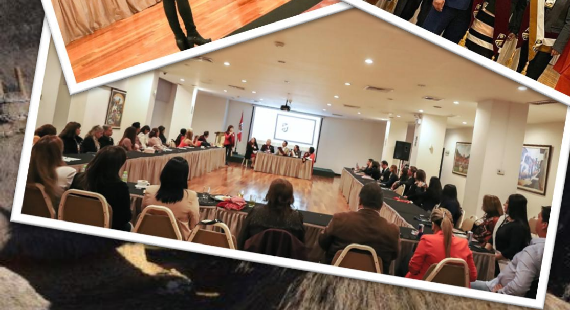
Convención Internacional Cusco 2022