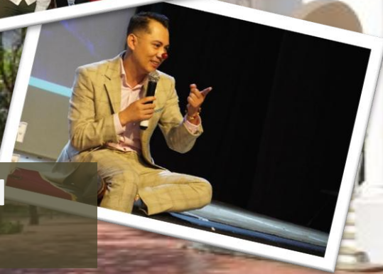
Convención Internacional Cancún 2023