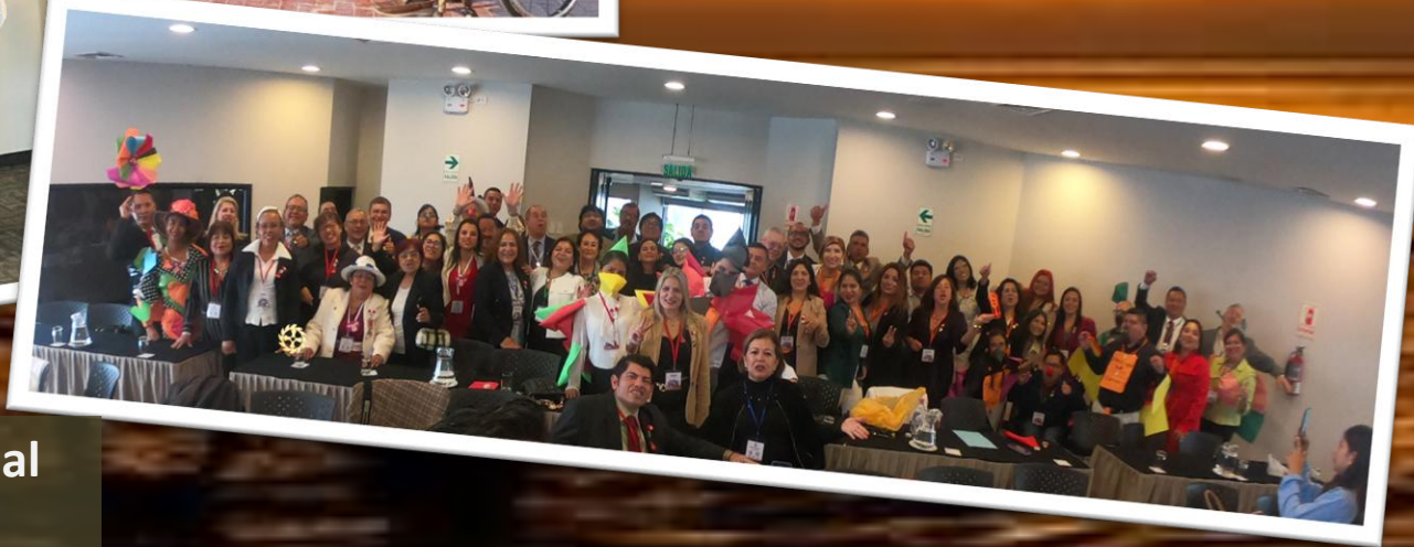
Convención Internacional Lima 2024